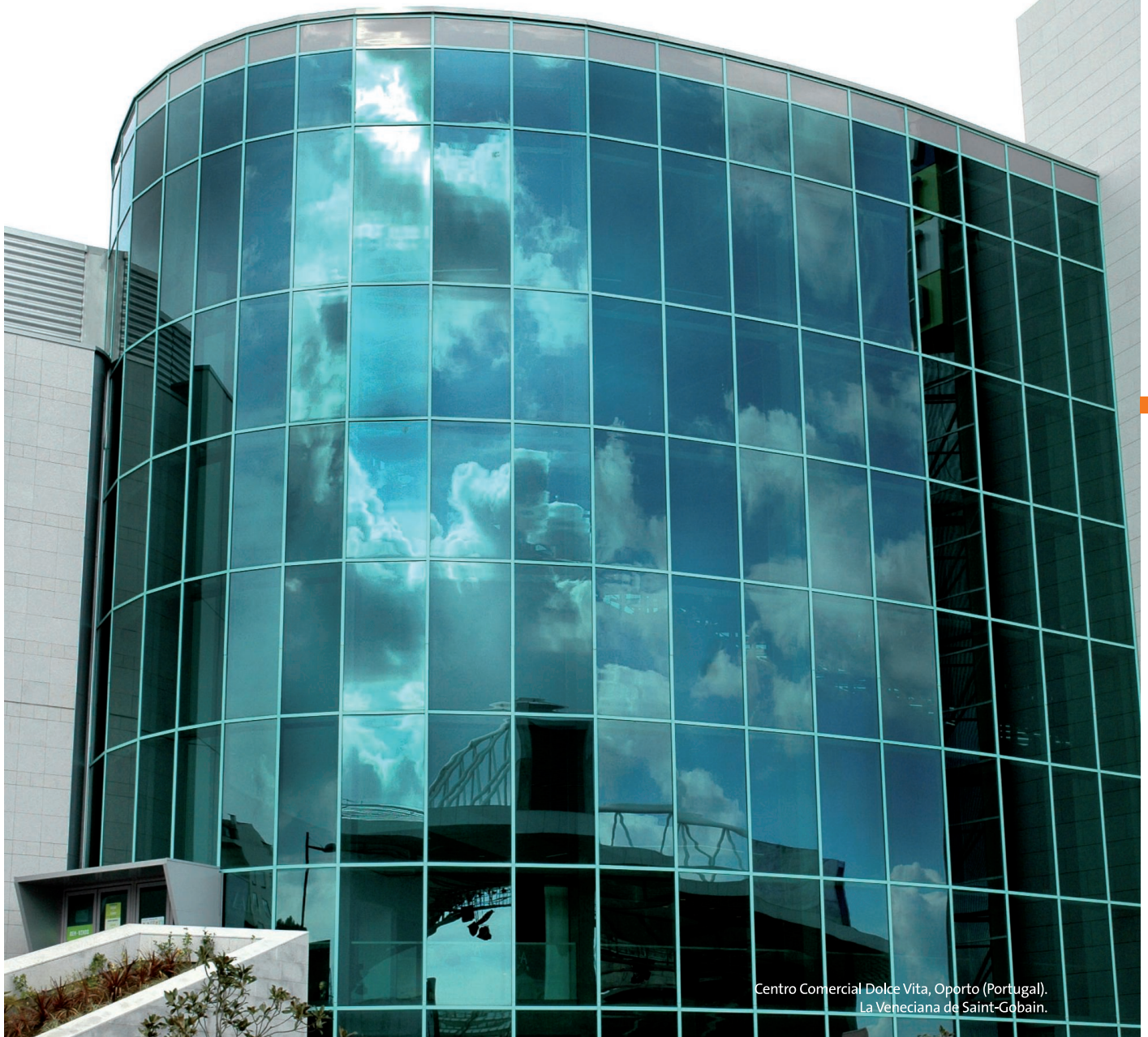
Centro Comercial Dolce Vita, Oporto (Portugal). La Veneciana de Saint-Gobain.