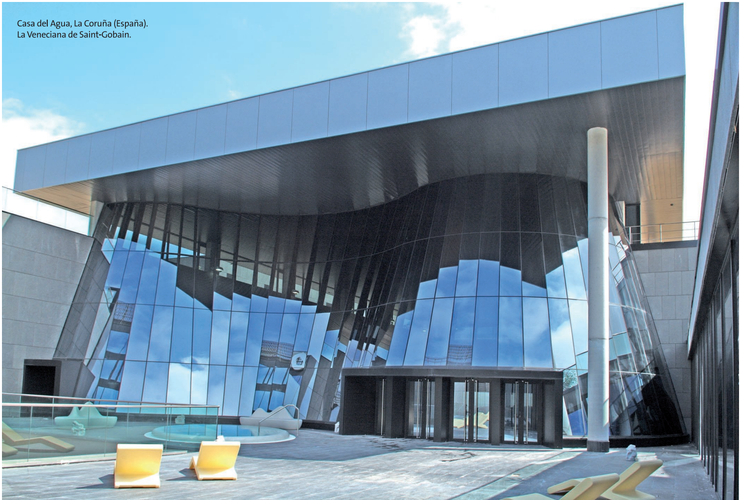
Casa del Agua, La Coruña (España). La Veneciana de Saint-Gobain.

números. El primero indica el vidrio base y los dos últimos la transmisión luminosa de la capa sobre sustrato SGG PLANILUX de 6 mm de espesor.