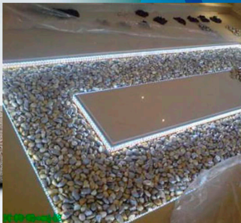
Laminado Extraclaro 10+10.2