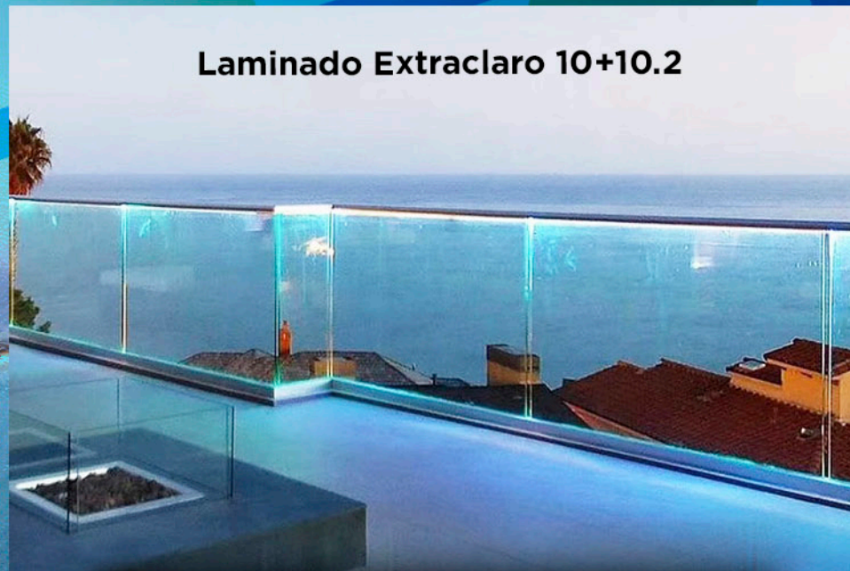
Laminado Extraclaro 10+10.2

Referente a los vidrios laminados de gran grosor que son normales, se acentúa muchísimo más esa tonalidad verdosa, todo lo contrario en los laminados de gran grosor Extraclaros que transmiten al paso de la luz una naturalidad a los objetos y paisajes, pasando casi desapercibidos por su altísima calidad en su transparencia.