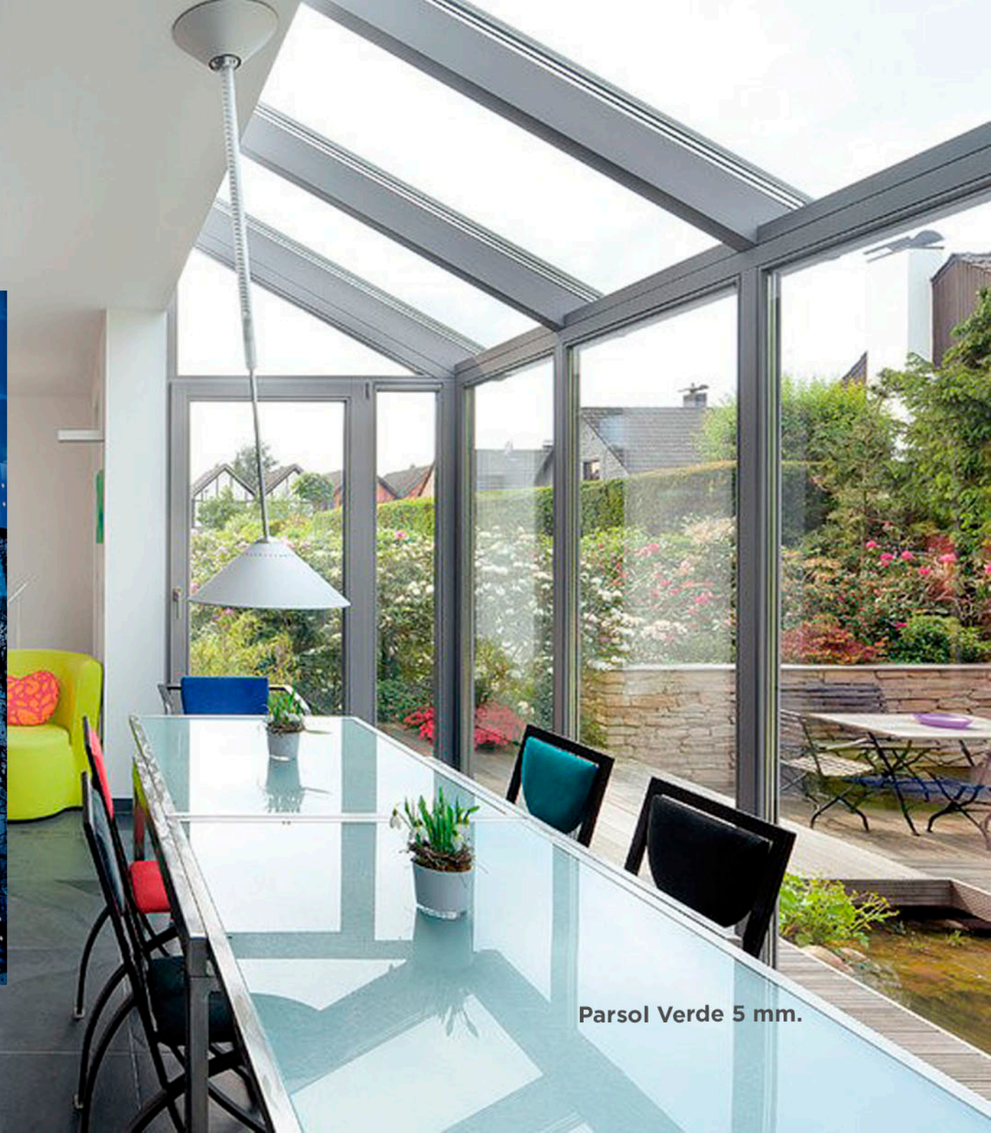
Parsol Verde 5 mm.