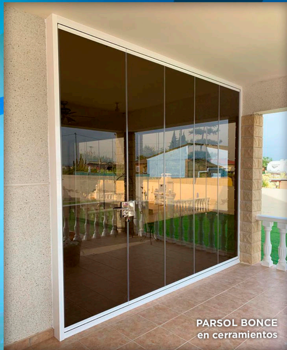
PARSOL BONCE en cerramientos