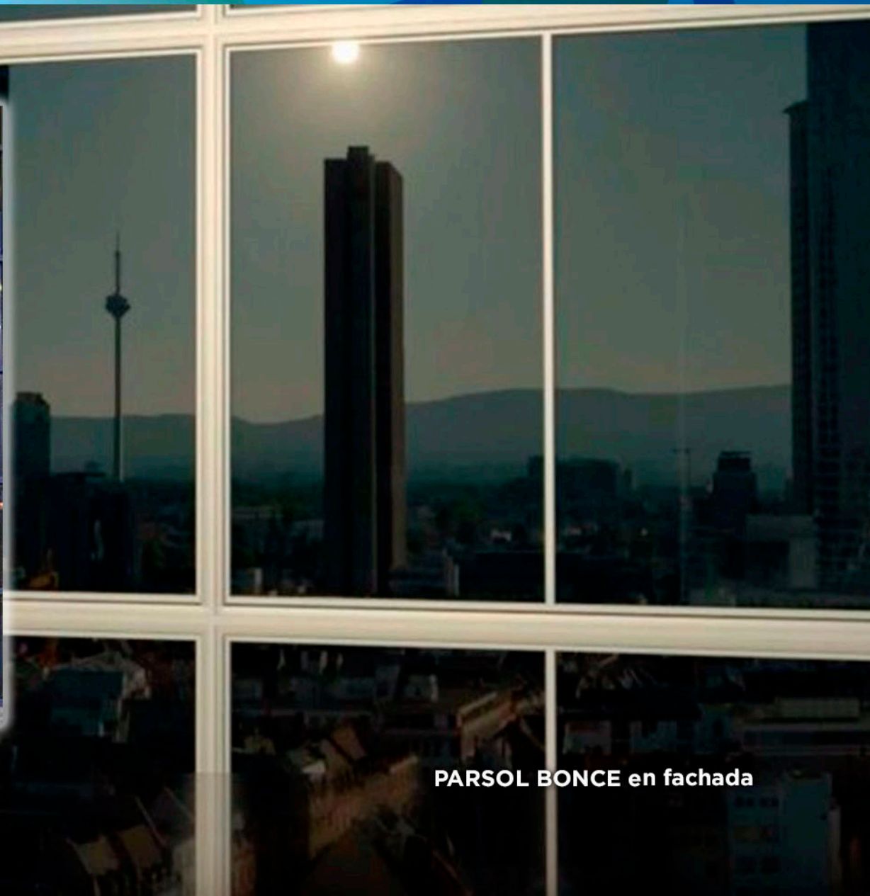
PARSOL BRONCE en fachada