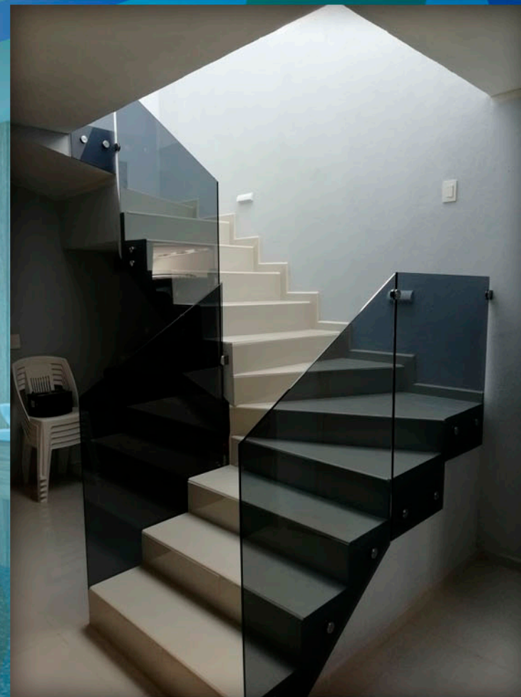
Parsol Gris en barandillas