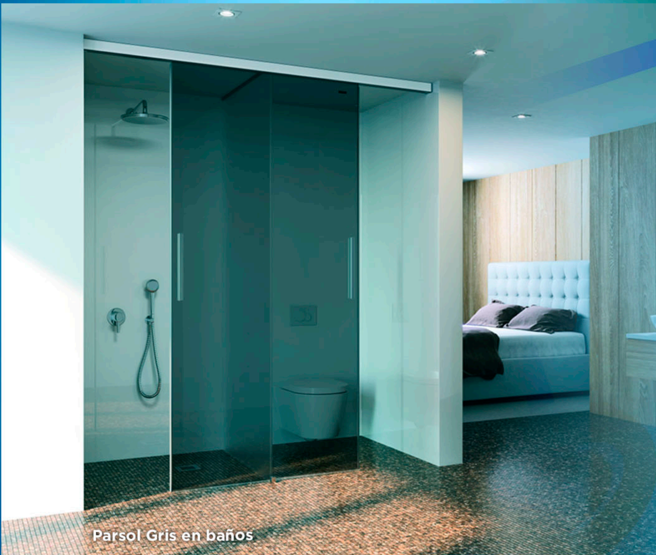
Parsol Gris en baños