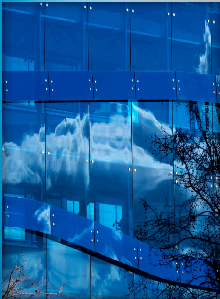
Parsol Azul Priva Blue 6 mm.